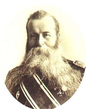
Иван Яковлевич Словцов

выполняли разносчики листов и счетчики. К переписи населения города Омска было привлечено 18 участковых распорядителей и 210 счетчиков, то есть в среднем один распорядитель приходился на 136 дворов и один счетчик на 11,6 дворов, 15,6 жилых строений, 15,5 квартир и 119 жителей.